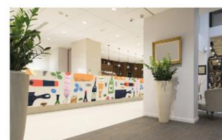
Arquitectura y diseño