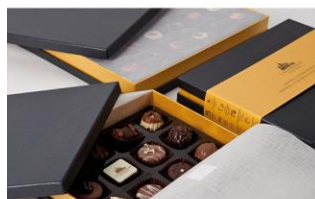
Alimentos y bebidas