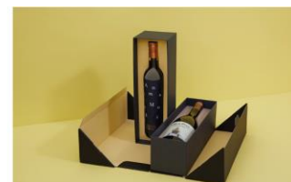
Vinos y licores