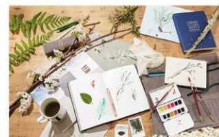
Arte y dibujos