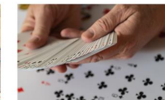
Juegos y cartas