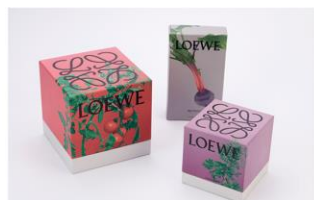
Belleza y cuidado personal