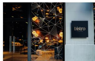
Publicidad y promoción