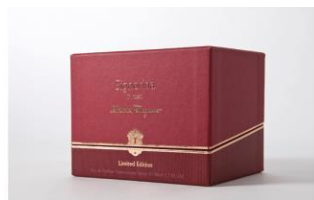
Joyería y relojería