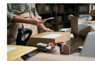
Transporte y logística