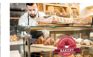
Venta al pormenor