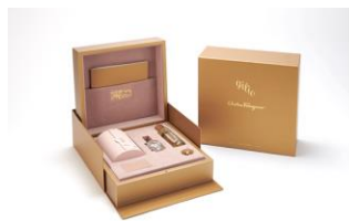
Moda y lujo