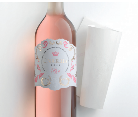
RE-PLAY: l'innovazione rivoluzionaria che trasforma il liner in etichette premium

In Fedrigoni ci siamo dati l'obiettivo di avviare il 100% dei nostri materiali di scarto a recupero, senza conferirli in discarica entro il 2030 (riferimento all'anno base 2019). Abbiamo chiuso il 2022 all'89%.